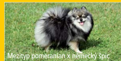
Mezityp pomeranian x německý špic