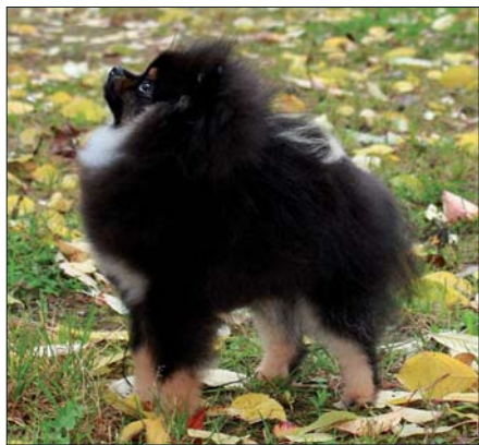
Nadějný šestiměsíční pomeranian

stopu tak, jak to vidíme u dnešního moderního pomeriana.