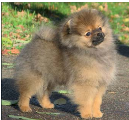
... a jako tříměsíční.

V roce 1888 byl první pomeranian Dick přivezen do USA a byl zapsán do plemenné knihy American Kennel Clubu. V roce 1892 se pak jako první zástupce plemene předvedl na výstavě v New Yorku. AKC ho uznalo již v roce 1900 a jeho popularita zde velmi rychle rostla. V roce 1909 byl americký Pomeranian Club přijat za řádného člena klubu AKC. V roce 1938 byl pomeranian