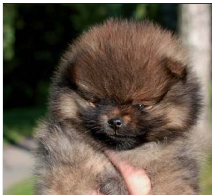
Ve věku 6ti týdnů...

Mezi prvními slavnými lidmi, kteří vlastnili psa pomeriana, byl teolog Martin Luther. Jeho pes se jmenoval Belferlein, a právě o něm se