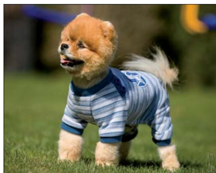
Ostříhaný na medvídko...

Ačkoliv jsou pomeraniani charakterističtí svou bohatou a hustou srstí, obecně z nich snadno uděláte krasavce. Stačí jenom několikrát týdně srst pár minut prokartáčovat, aby na některých místech (hlavně kolem uší) nezaplnatěla. Jinak se dá srst považovat za samočisticí a na rozdíl od jiných plemen není pomeranian doma cítit psinou. Ze zdravotních důvodů by se však měla vystříhat srst mezi polštářky na chodidlech a kolem konečniku. Občas ho lze vykoupat. Avšak před výstavou je koupání a větší úprava nutná. V dnešní době patří pomeranian k jedněm z nejuspěšnějších a nejoblíbenějších společenských plemen na výstavách. Bez kvalitní úpravy si ho zde ani nelze představit. Dokresluje to totiž jeho kompaktní postavu. Kvalitní stříhová úprava je opravdu „třešničkou na dortu“. Pomeranianovi, který nemá standardní hlavu, srst a postavu, nepomůže nic, ani stříh. Naopak, sestříh může vyzdvihnout jeho nedostatky. Ovšem i sebekvalitnější pes, vytažený těsně před výstavou z ne-